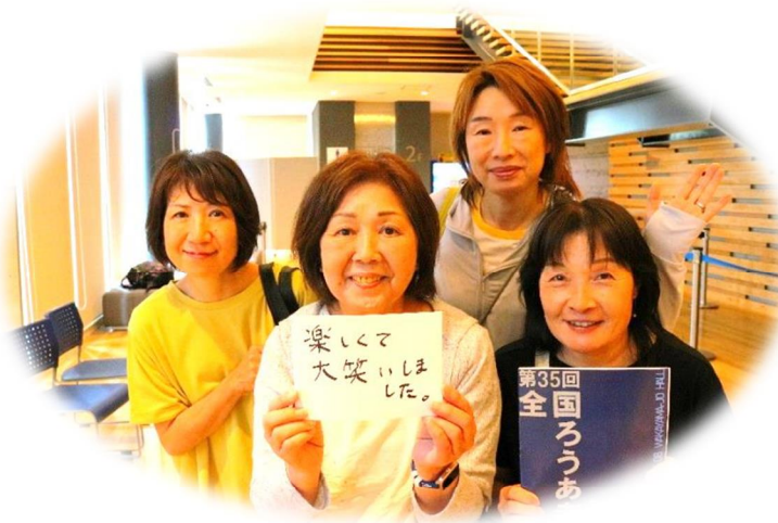
和歌山県 きこえる人

<連絡先> 640-8319 和歌山市手平 2-1-2 和歌山ビッグ愛 6階 (一社)和歌山県聴覚障害者協会 「第72回全国ろうあ者大会実行委員会 事務局」 FAX:073-488-5233 TEL:073-488-5243 mail : jndfw.2024@watyosyokyo.or.jp